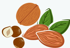
Les fruits à coque : noix, noisettes, amandes non salées, etc.