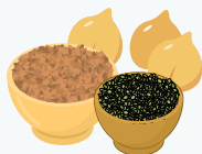
Les légumes secs : lentilles, haricots, pois chiches, etc.