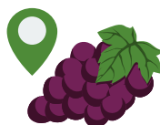
Les aliments de saison et les aliments produits localement