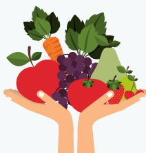
Les fruits et légumes