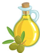
L'huile de colza, de noix, d'olive