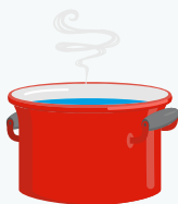
Le "fait maison"