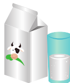
Une consommation de produits laitiers suffisante mais limitée